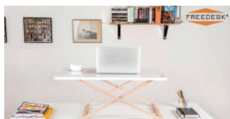
e-oct フリーデスクライザー 42,900 円～