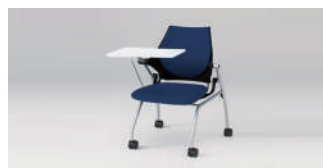
イトーキ イブサチェア 46,000 円～