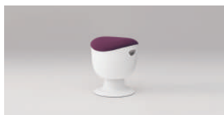
イトーキ エッグノックスツール 58,000 円～