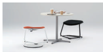
イトーキ swingy 32,000 円～