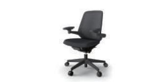
イトーキ ノートチェア 38,000 円～