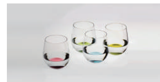
ワイングラス(リーデル) 2,000円～