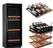
ワインセラー(ユーロカーブ) 490,000円～