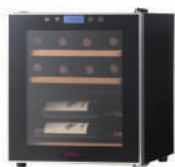
ワインセラー(ファンヴィーノ) 45,800円～