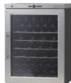
ワインセラー(シャンブレア) 419,000円～