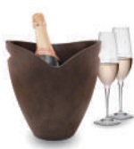
ワインクーラー(ウッド調) 3,850円～