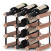
ワインラック(ボルテックス) 3,080円～