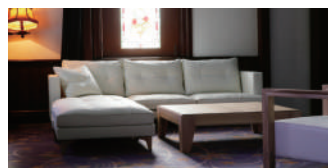
シギヤマソファ 90,000 円～