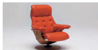
カリモク・ザ・ファースト 172,800 円～