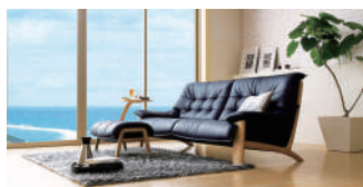
カリモクソファ 100,000 円～