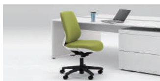
トルテチェア(イトーキ) 23,400円~