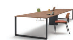
knot work(イトーキ) 100,000 円～