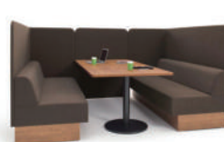
アドサイト(イトーキ) 308,700 円～