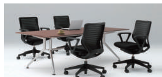
エビオスチェア(イトーキ) 36,300 円～